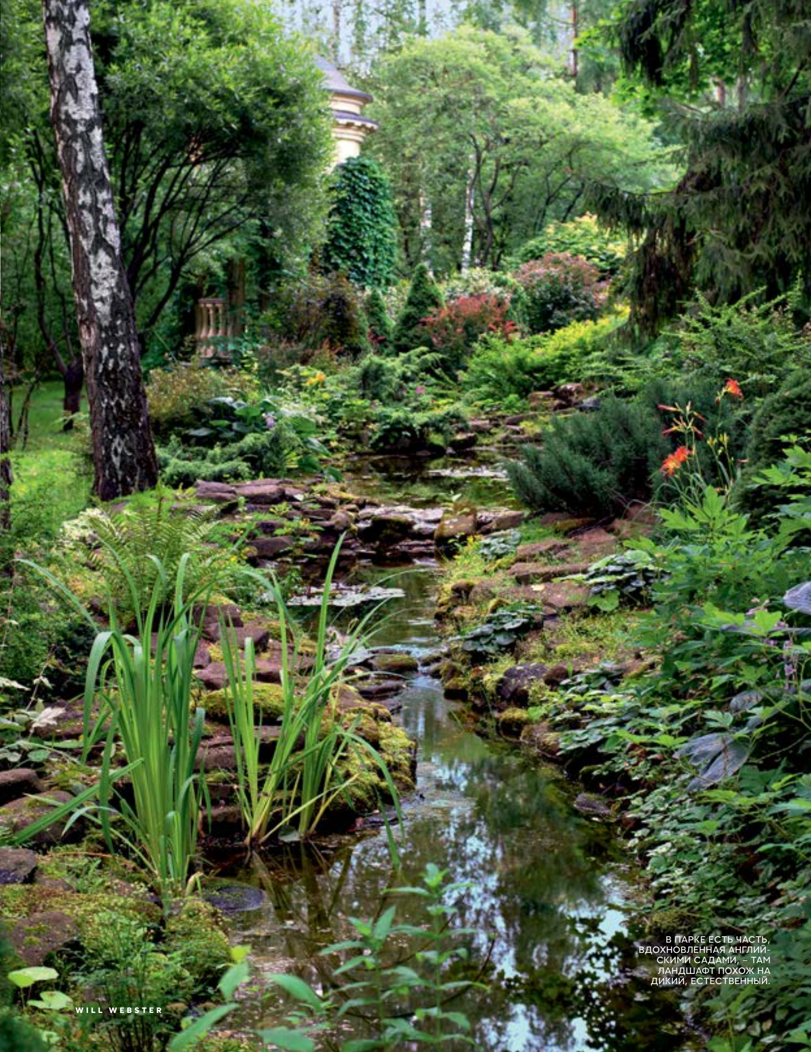
В ПАРКЕ ЕСТЬ ЧАСТЬ, ВДОХНОВЛЕННАЯ АНГЛИЙСКИМИ САДАМИ, – ТАМ ЛАНДШАФТ ПОХОЖ НА ДИКИЙ, ЕСТЕСТВЕННЫЙ.

СТИЛЬ: КАТЕРИНА ЗОЛОТОВА, ПРИЧЕСКИ: МАКИЯЖ, ГРУМИНГ: МАКСИМ ИГНАТЬЕВ, КАТАРИНА КОЧКА, НАТАЛИЯ МАЛОВА, ОЛЬГА ЧАРАНДАЕВА / THE AGENT, АССИСТЕНТЫ: ФОТОГРАФ: ИВАН ГОЛОВАНОВ, АНДРЕЙ ХАРЬБИН, ДМИТРИЙ КОНСТАНТИНОВ / BOLD, АССИСТЕНТЫ СТИЛИСТА: ФАРИДА МАМИШЕВА, АНАСТАСИЯ ШОХИНА, АНАСТАСИЯ ЧЕБОТАРЕВА, ПРОДЮСЕР: ЕЛЕНА СЕРОВА, АССИСТЕНТ ПРОДЮСЕРА: КСЕНИЯ ФИНОГЕЕВА