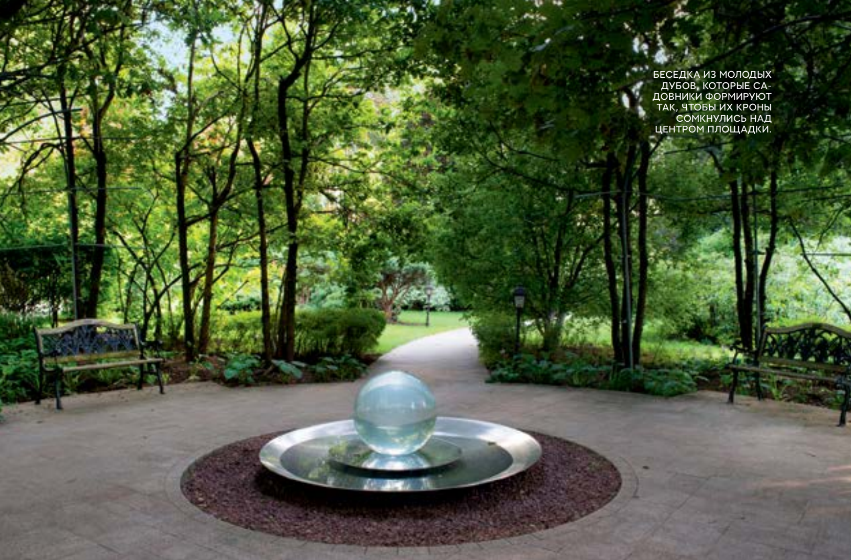
БЕСЕДКА ИЗ МОЛОДЫХ ДУБОВ, КОТОРЫЕ САДОВНИКИ ФОРМИРУЮТ ТАК, ЧТОБЫ ИХ КРОНЫ СОМКНУЛИСЬ НАД ЦЕНТРОМ ПЛОЩАДКИ.