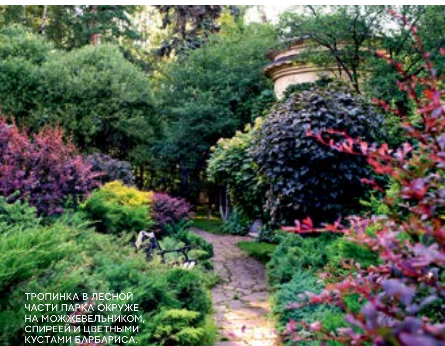
ТРОПИНКА В ЛЕСНОЙ ЧАСТИ ПАРКА ОКРУЖЕНА МОЖЖЕВЬЛЬНИКОМ, СПИРЕЕЙ И ЦВЕТНЫМИ КУСТАМИ БАРБАРИСА.

«Больше всего мне нравится, что архитектор сада Александр Гривко сумел соединить парк и сад, лес и огород так, что все это воспринимается как единое целое».